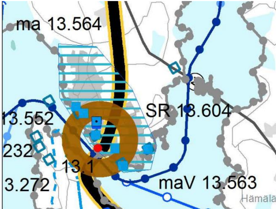
Kuva 3: Ote maakuntakaavojen yhdistelmästä