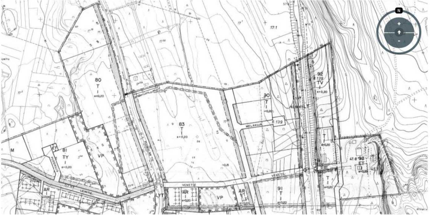
Kuva 5. Otevoimassa olevasta asemakaavasta (pohjoisosa)