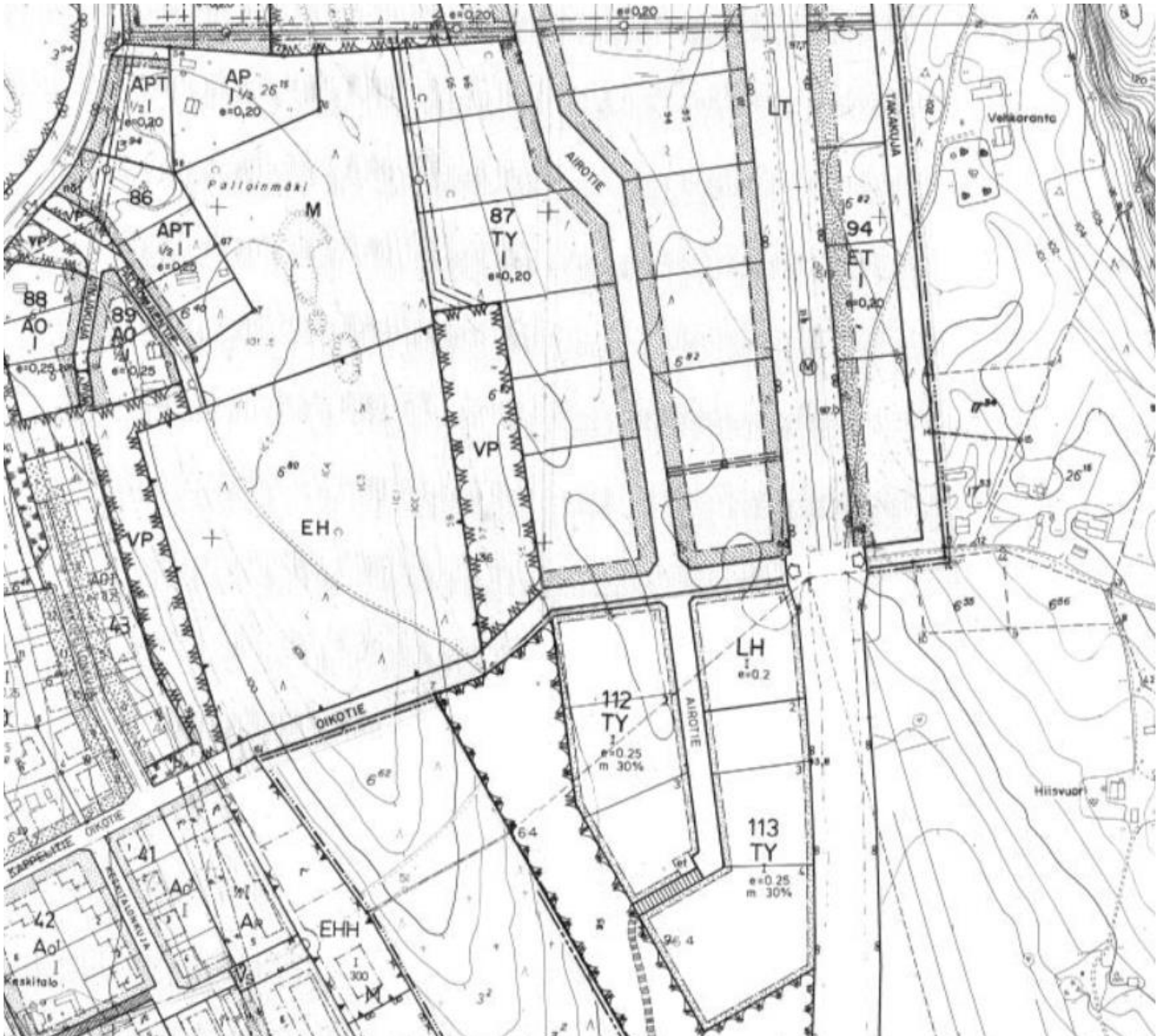
Kuva 6. Ote voimassa olevasta asemakaavasta (eteläosa)