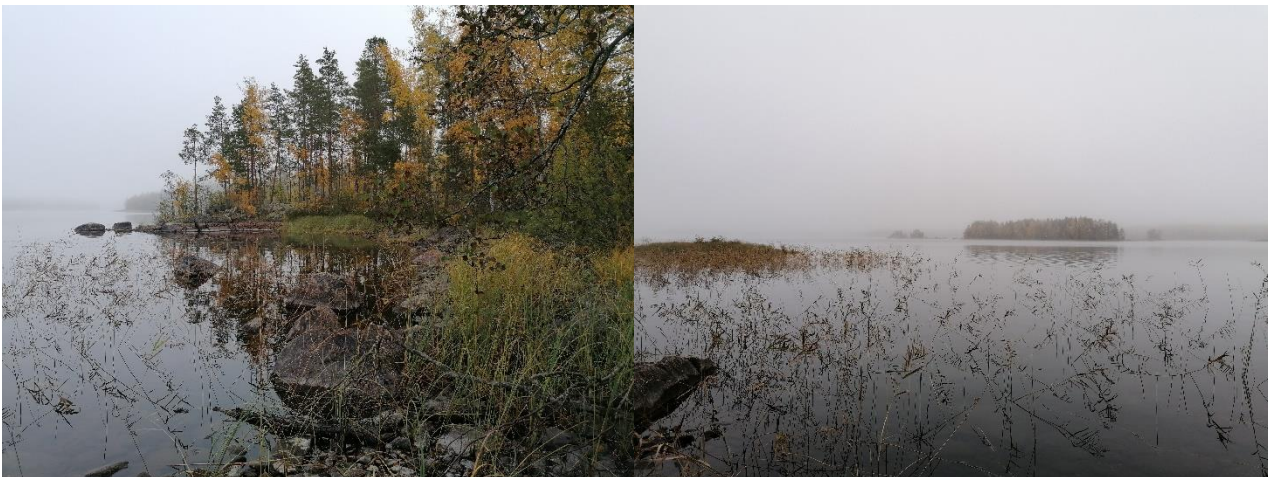
Sirtoalueen rantaa eli rakennuspaikan mahdollinen uusi sijainti

Kunnanvaltuuston hyväksymispäätöksestä on mahdollisuus tehdä valitus Itä-Suomen hallinto-oikeuteen.