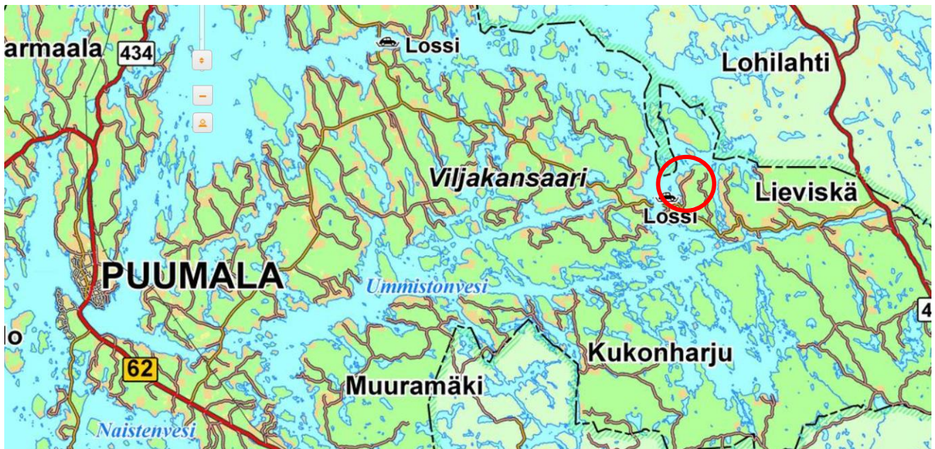
Suunnittelualueen likimääräinen sijainti on ympyröity punaisella.

Ohessa on kartta, josta selviää alueiden likimääräinen sijainti Rongonsalmella Lieviskän länsipuolella ja Viljakansaaren itäpuolella. Alue sijaitsee Rongonsalmen lossin pohjoispuolella, Ruohokaarre-nimisen tien varrella.